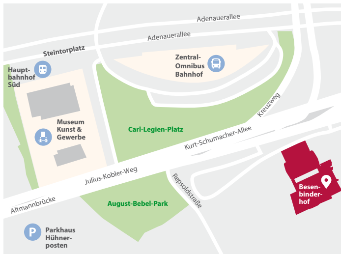
Besenbinderhof Besenbinderhof 57a, 20097 Hamburg www.besenbinderhof.com